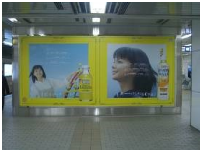
梅田ビッグボード1号（1面）